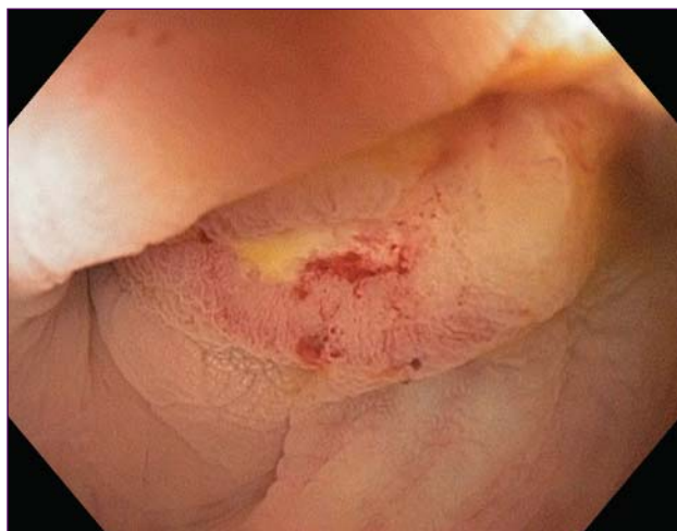
Fig. 2./Obr. 2.